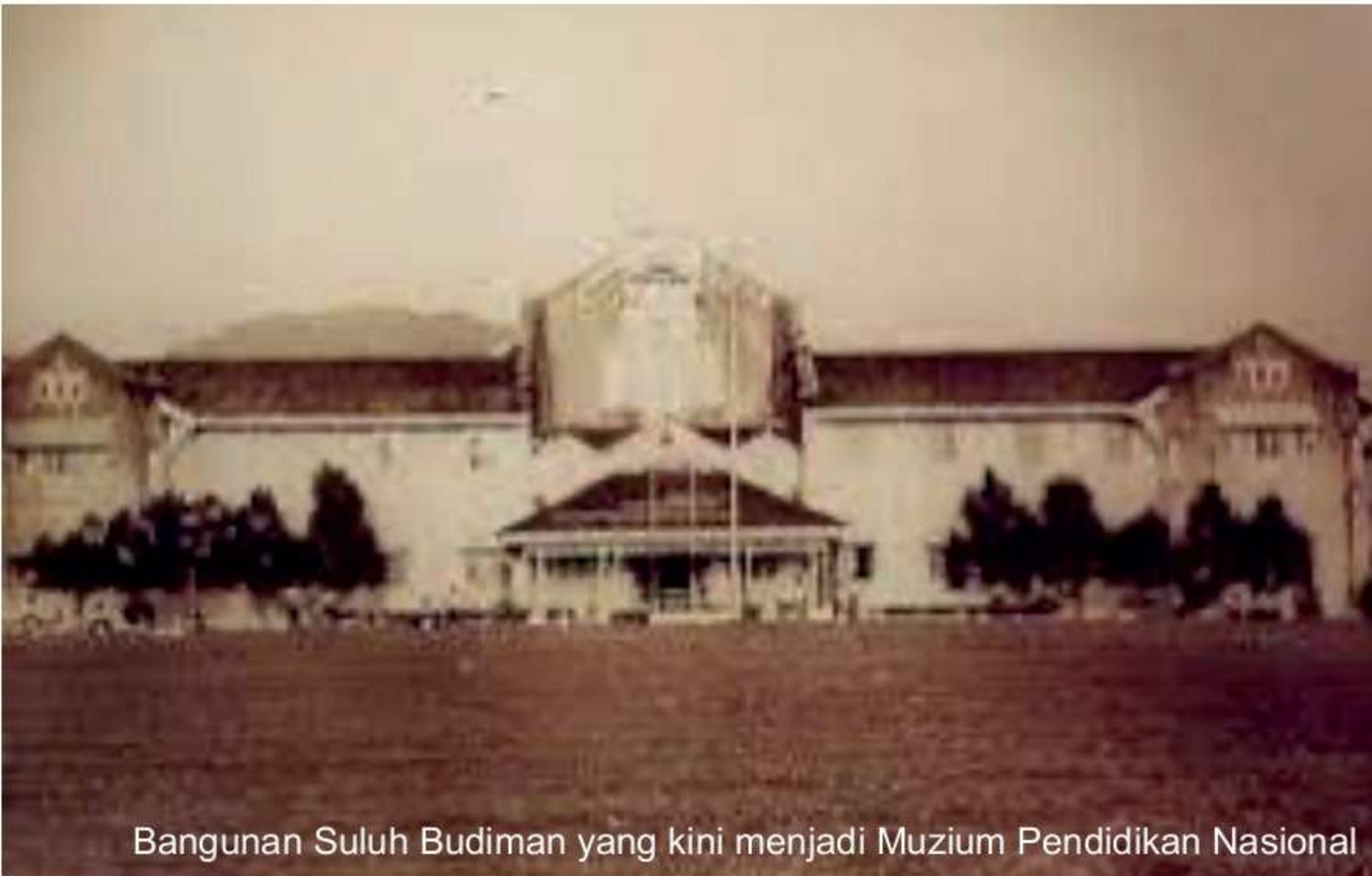
Bangunan Suluh Budiman yang kini menjadi Muzium Pendidikan Nasional