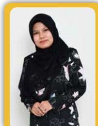
Pejabat Karang Mengarang