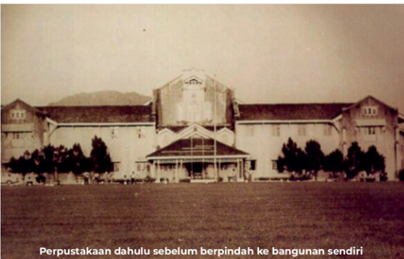
Perpustakaan dahulu sebelum berpindah ke bangunan sendiri

pekerja profesional yang terlatih dalam bidang kepustakawanan.