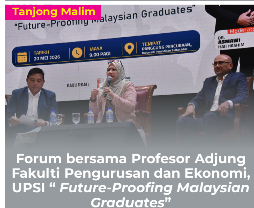
Forum bersama Profesor Adjung Fakulti Pengurusan dan Ekonomi, UPSI "Future-Proofing Malaysian Graduates"