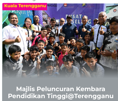
Majlis Peluncuran Kembara Pendidikan Tinggi@Terengganu

Selain Malaysia, pertandingan berprestij tersebut turut disertai peserta dari Thailand, Brunei, Indonesia, Hong Kong, Taiwan, Singapura, China, Peru, Kanada dan Vietnam.