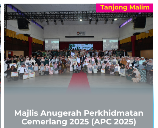
Majlis Anugerah Perkhidmatan Cemerlang 2025 (APC 2025)