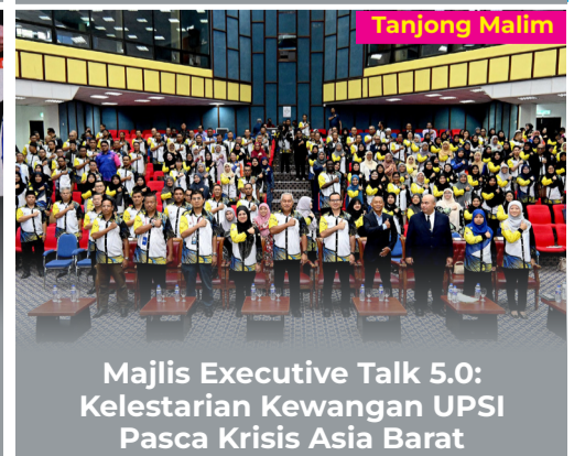
Majlis Executive Talk 5.0: Kelestarian Kewangan UPSI Pasca Krisis Asia Barat